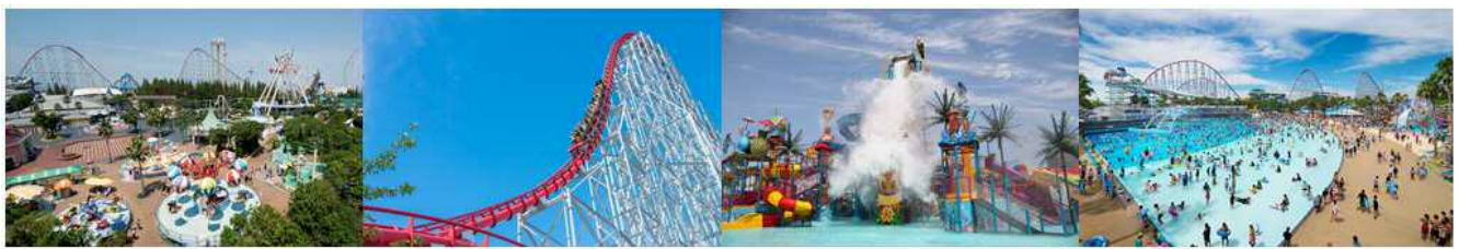
ナガシマスパーランド

日本最大級の遊園地「ナガシマスパーランド」「ジャンボ海水プール」や天然温泉露天風呂「長島温泉 湯あみの島」、店舗数日本最多のアウトレットまで揃う子どもから大人まで楽しめるエンターテインメントを集めた一大リゾートでございます。